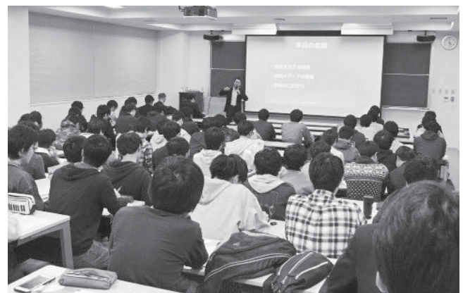
研究開発実践論の講義風景

未来戦略懇談会では、「研究開発実践論」と「企業フォーラム」を活動の2つの柱としています。「研究開発実践論」は企業における研究開発の実際や大学における研究との違い等について学生が理解を深めることを目的とした、電気・情報系の修士課程の学生を対象