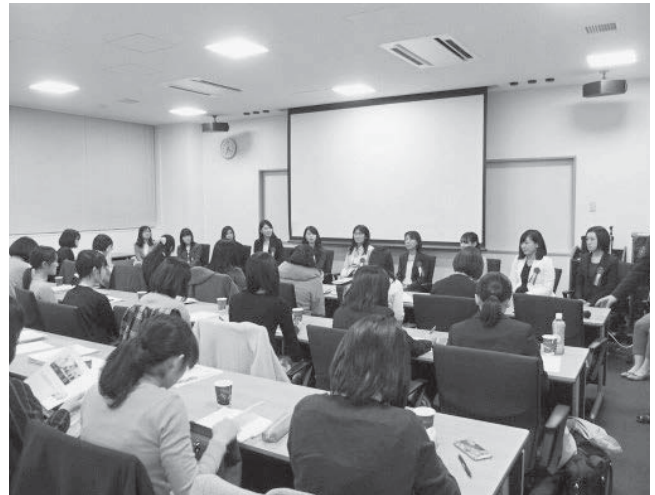
女性フォーラムの様子（昨年度）